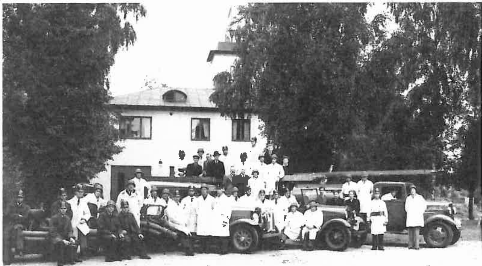
År 1939 kunde köpingens brandkår flytta in i den nybyggda brandstationen vid Järnvägsgatan. Det var en stor dag för kåren, som på bilden finns i full styrka med sprutor och fordon.